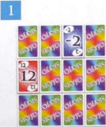
Mise en place de départ pour un joueur

Exemple : le joueur A révèle un 12 et un -2, la somme obtenue est 10. Le joueur B révèle un 4 et un 2, la somme obtenue est 6. Comme le joueur A a révélé la plus grande somme, il commence la partie.